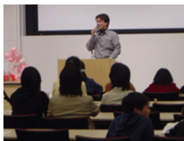
講師の話を真剣に聞く子供達