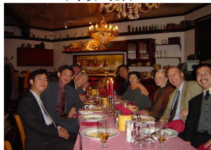
バーサ市で先陣達と懇親会