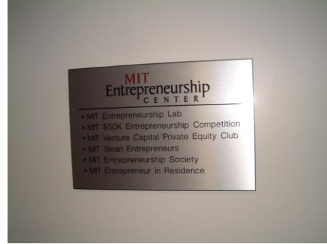
MIT の Entrepreneurship Center はメニューが充実