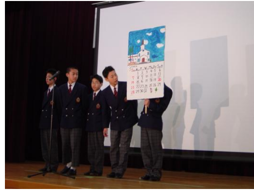
学校のお土産物を開発発表する生徒 (初芝堺中学校)