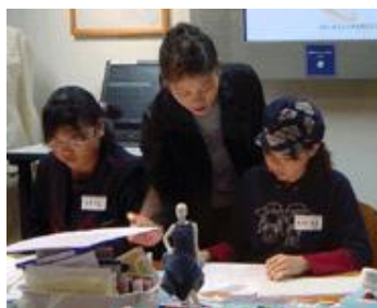
デザイナーに体験。ワクワク。