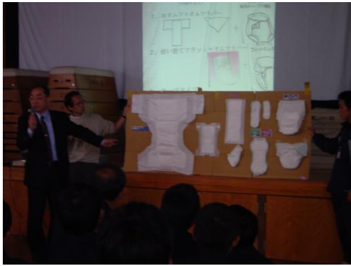
「福祉商品の開発」で起業家の話しを聞く (修学院中学校)