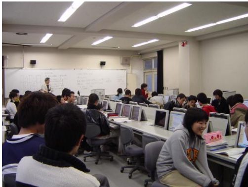
チームで話し合う