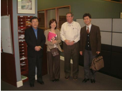
Stanford の TLO で