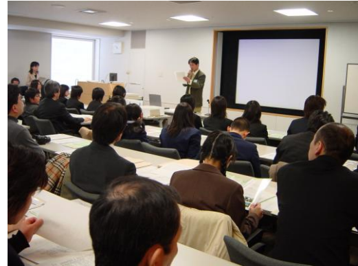
成果発表会：指導者の発表に熱心に聞き入る参加者 (東大阪市立小阪中学校)