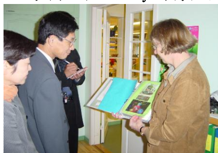
フィンランドの保育園で校長先生の説明を受ける