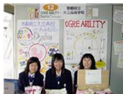
小・中学生部門で優勝した福西小学校と高校生部門で優勝した大江高等学校のチーム