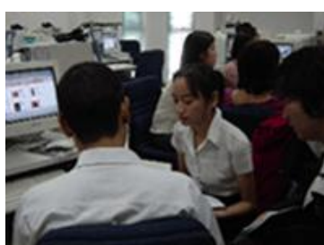
事業プランを練る学生たち