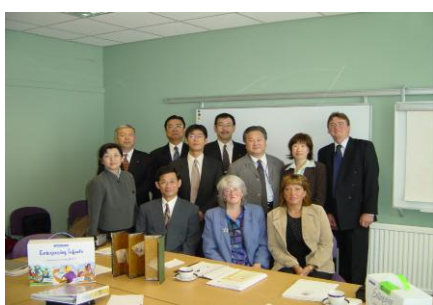
スコットランド Strathclyde 大学にて

http://www.entreplanet.org/whats_new/inspection2003.pdf