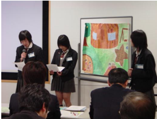
「理想の幼稚園」を説明する生徒 (東大阪市立小阪中学校)